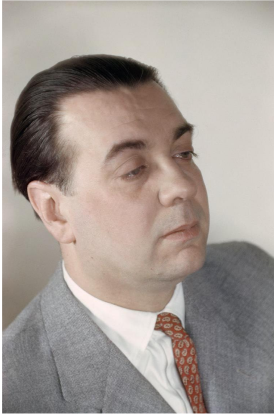
Jorge Luis Borges, Buenos Aires 1943

Del 10 de septiembre al 21 de noviembre de 2021