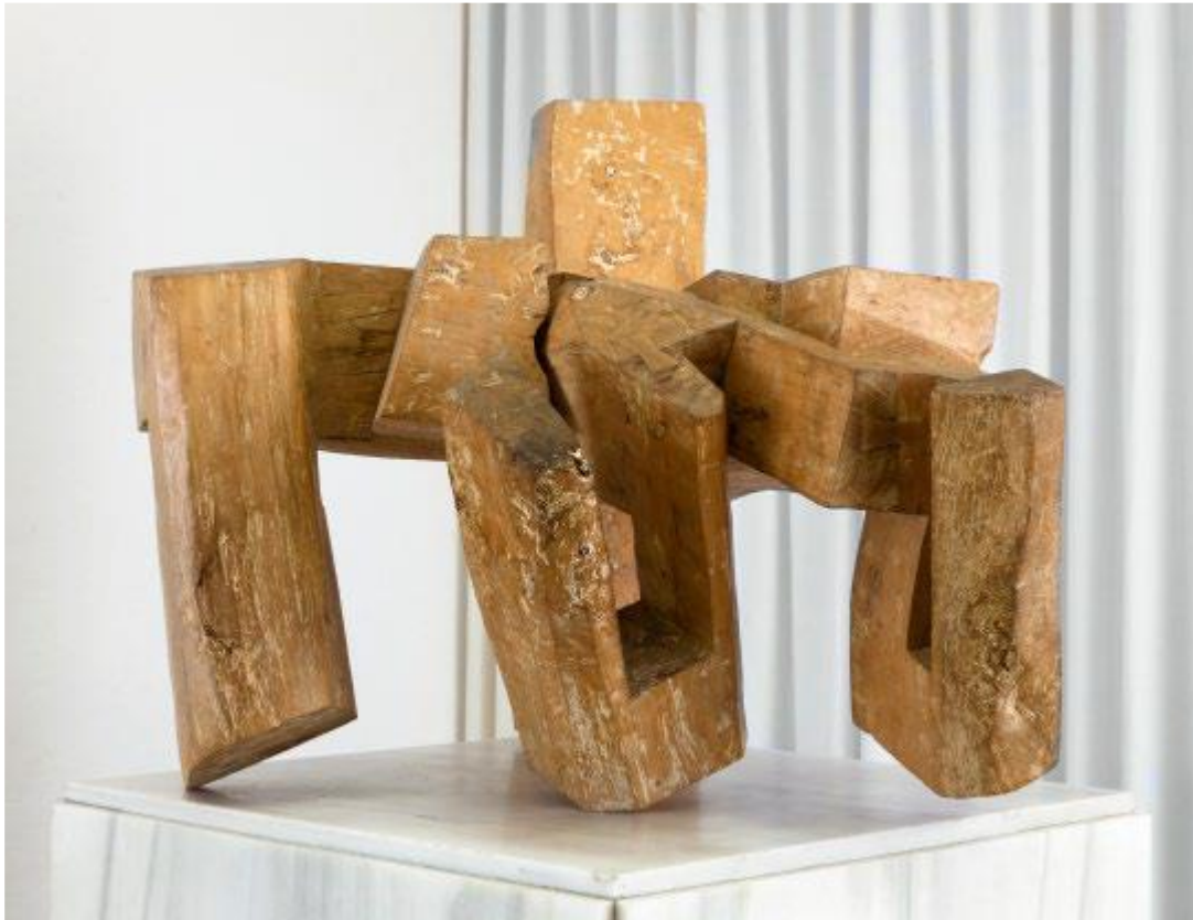
Eduardo Chillida. Abesti gogorra IV [Canto rudo IV], 1959–1964

Del 10 de junio al 11 de septiembre de 2022