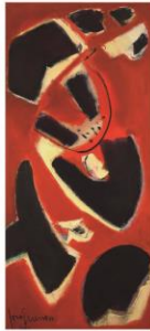
Ascendentes, 1954. Óleo sobre lienzo (162 x 64 cm)